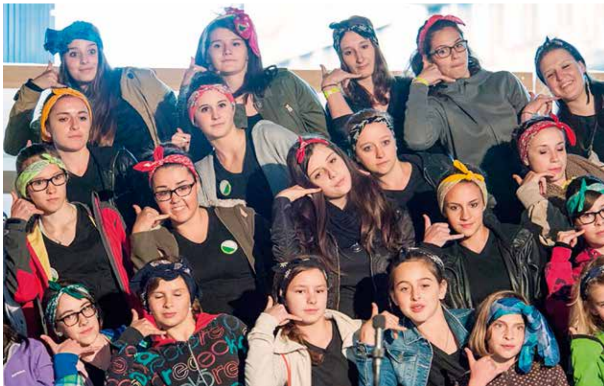
Er il Chor d'affons Sumvitg participescha a la sentupada da chant a Mustér.

In dals puncts culminants da quest tschintgavel SKJF vegn ad esser il choral. In choral è in musical, en il qual il chant da chor stat en il center. En il choral che vegn chantà a Mustér, van 1'200 uffants a la tschertga da la melodia assoluta, la melodia che fa star airi il temp, la melodia che purifitgescha las olmas da las personas che audan questa melodia. E tut quai sa chapescha grazia al chant en quatter linguas. Ma il festival na consista betg mo dal choral. Las aulas, baselgias e chapluttas en il conturn da Mustér