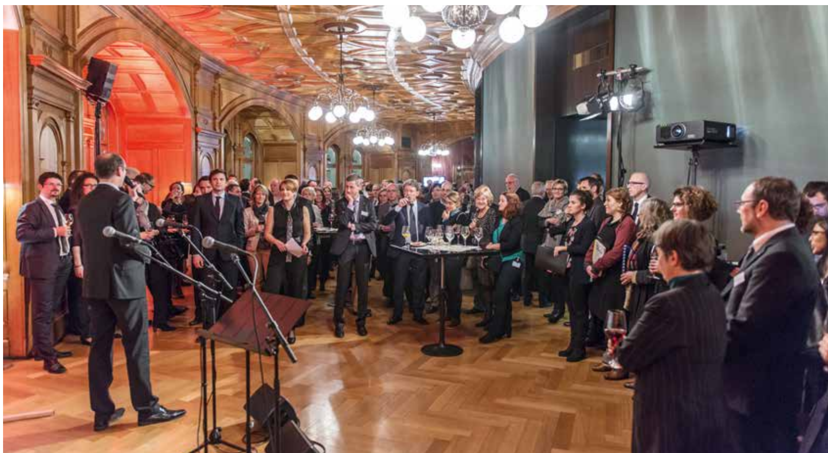
Il cusseglier naziunal Martin Candinas beneventa amias ed amis da la Svizra rumantscha en la «Galerie des Alpes» en Chasa federala.