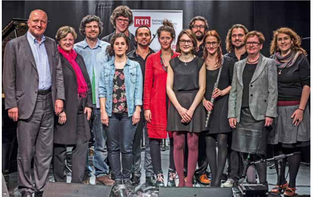
Musicistas e musicists e las visitas èn sa pustadas per il purtret final da la turnea 2014.

Cha da Fö: Jau sun ma dumandà, sche quai giaja cun trais bands senza survegnir pli gronds problems in cun l'auter. Mintgin lavura in zic auter ... La finala avain nus simpla-