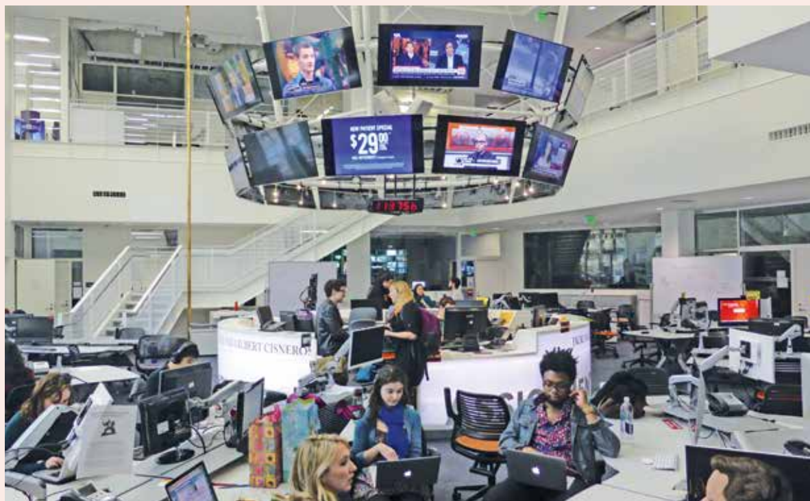
Ina sala da studi da la Anaheim School of Communication and Journalism a Los Angeles.

Sco perlas en ina chadaina en enfiladas en il sid da San Francisco las grondas firmas Apple, Intel, Google