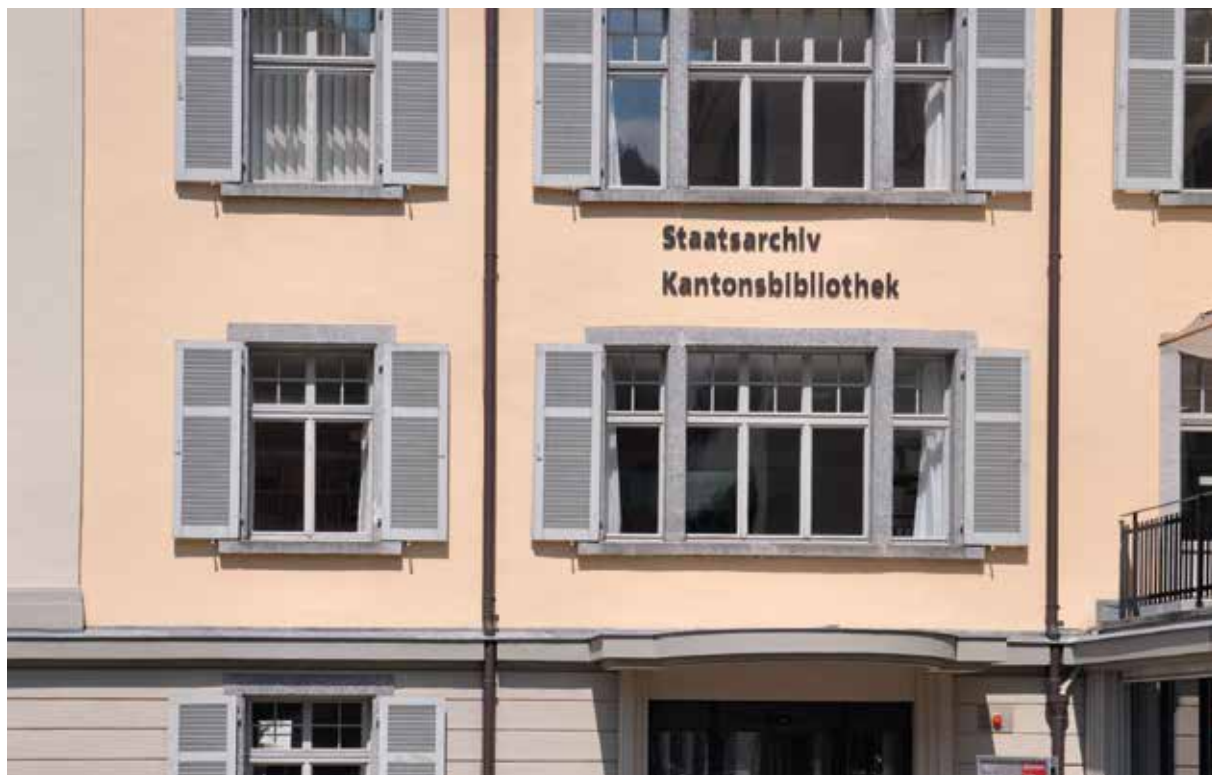
En la Biblioteca chantunala pon ins emprestar emissiuns da Radiotelevision Svizra Rumantscha.

Dapi 20 onns furnescha RTR emissiuns da radio e da televisiun a la Biblioteca chantunala cun l'accord da rimnar questas producziuns en fa-