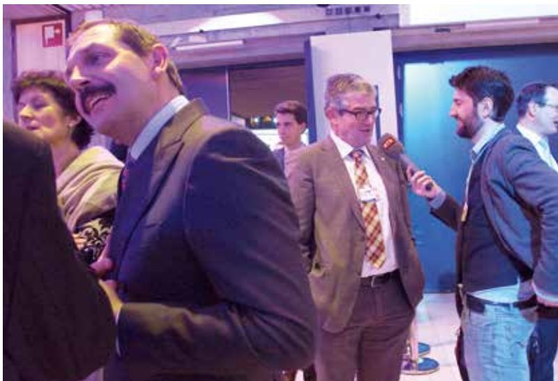
La politica grischuna e Michel Decurtins a l'avertura uffiziala dal WEF, dal Forum mundial d'economia 2015.