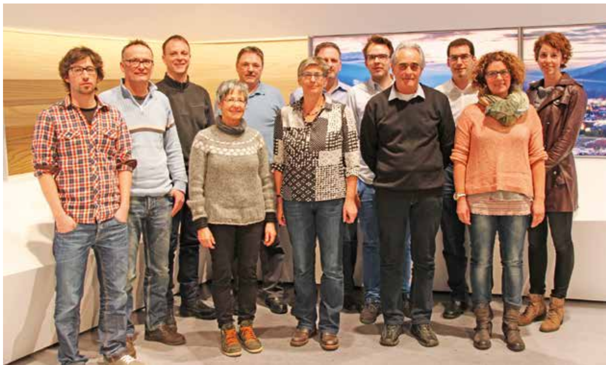
Commembers dal Cussegl dal public SRG.R durant la visita dal nov studio da televisiun da RTR.