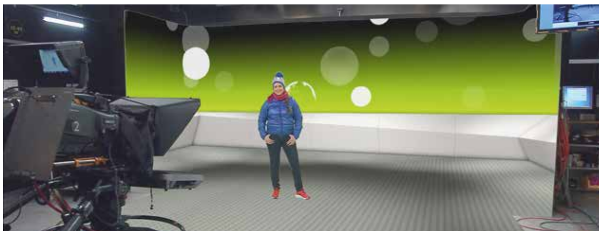
La culissa virtuala dal Minisguard vegn creada en la «greenbox».